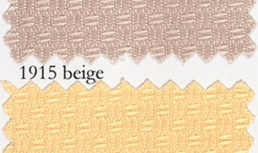
1918 hell gelb (300)