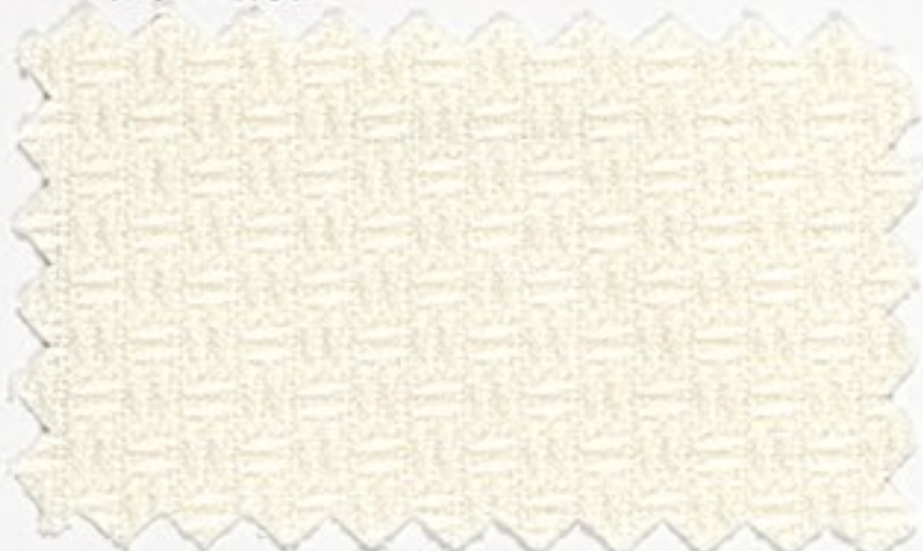
1190 1/2 gebleicht (2)