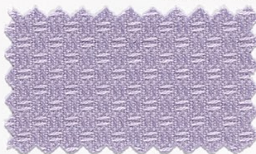
1925 flieder (108)