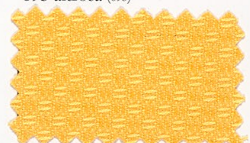
192 gelb (305)