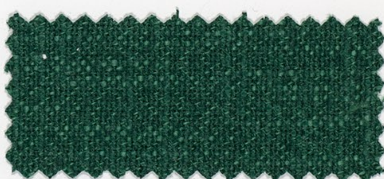
7460 dunkel grün