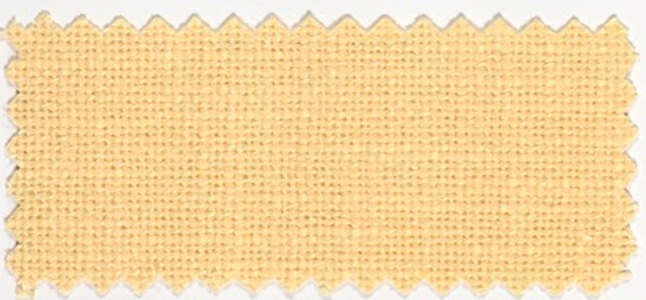
7418 hell gelb