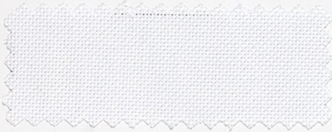
2110 weiss (1)