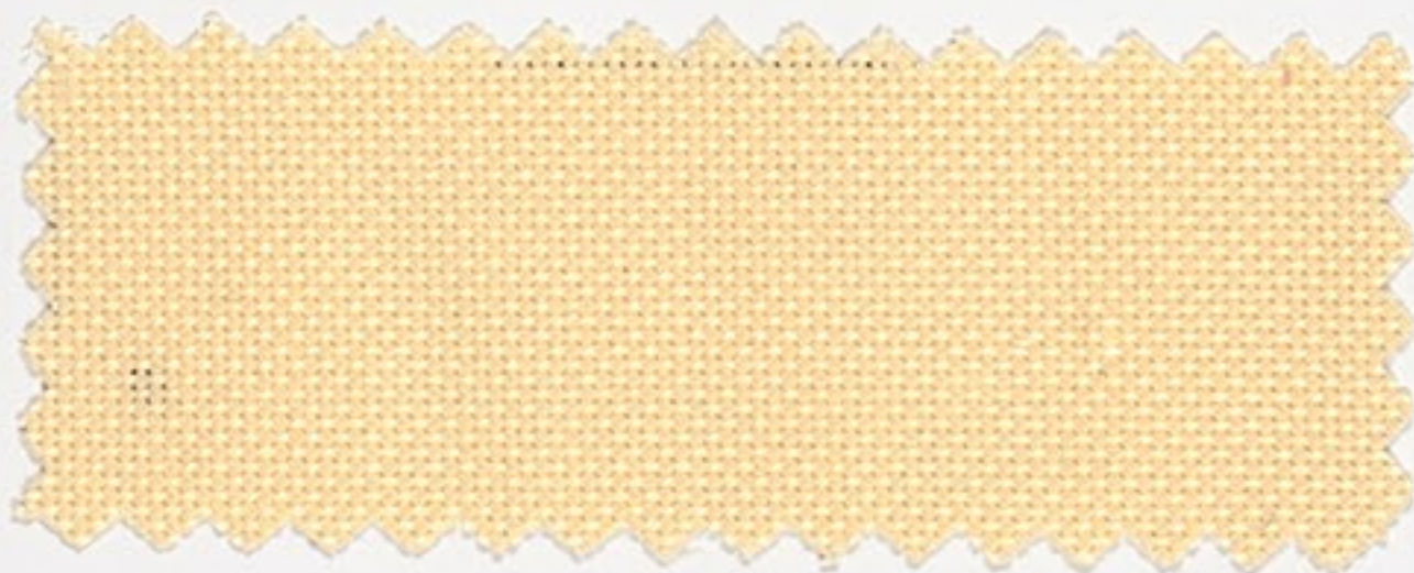
2118 hell gelb (300)