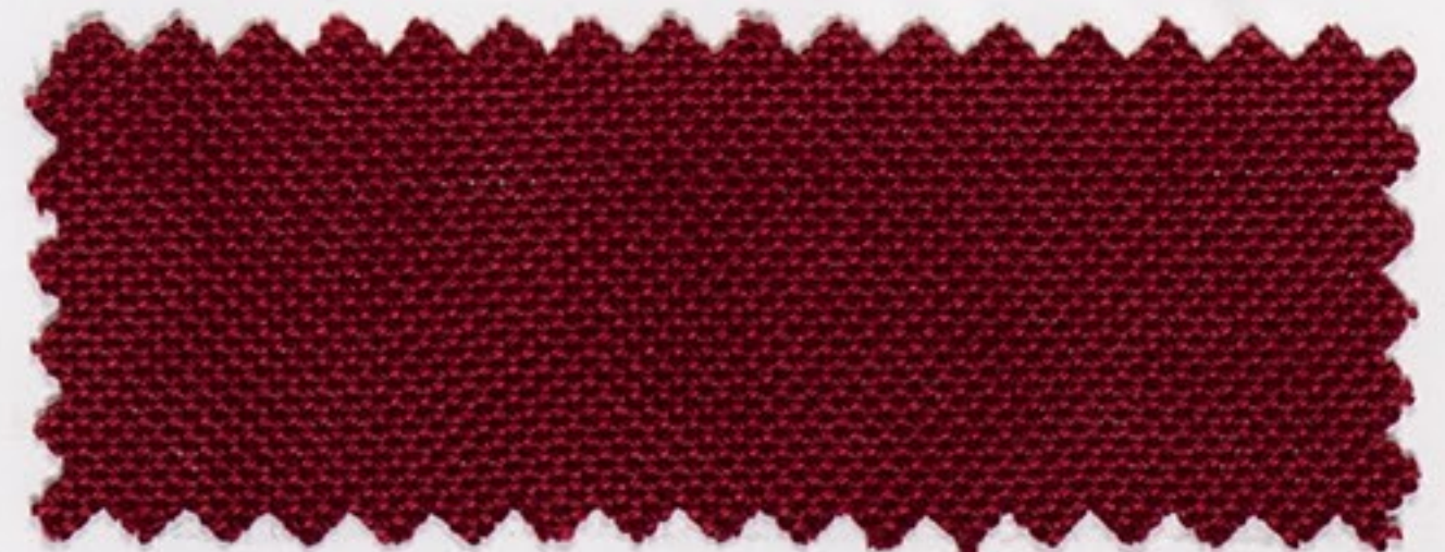
2175 weinrot (44)