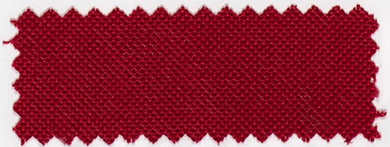
2170 dunkel rot (47)