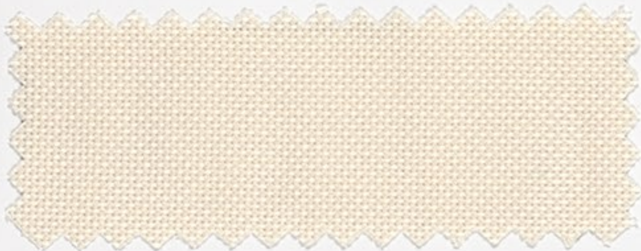
2112 creme (386)