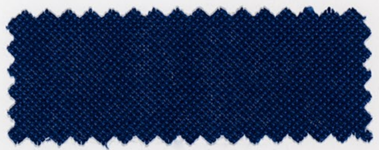
2186 dunkel blau (149)