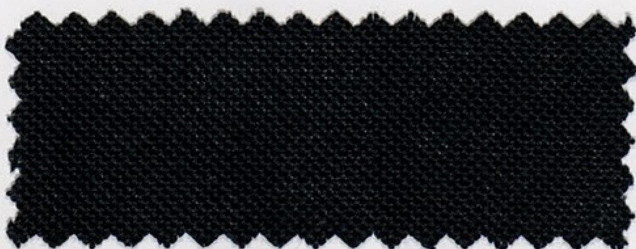
2195 schwarz (403)