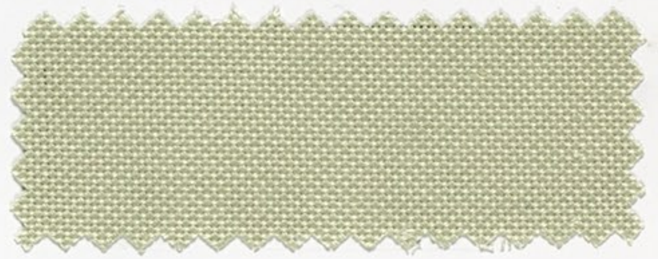
2150 mandelgrün (213)