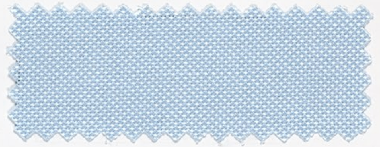
2180 hell blau (128)