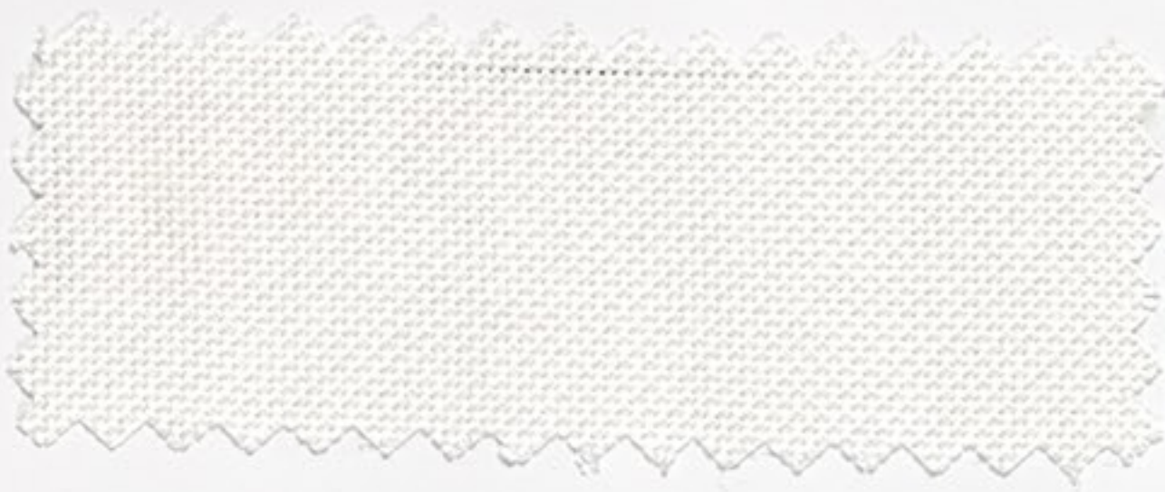
2105 1/2 gebleicht (2)

11 Faden / cm, 50 % Baumwolle, 50 % Modal 183 cm breit, mercerisiert, pflegeleicht