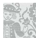
silber Art.-Nr. 76291