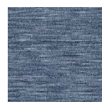
marine Art.-Nr. 6886