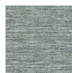
schiefer Art.-Nr. 6861