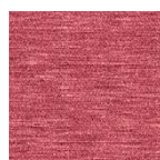
bordeaux Art.-Nr. 6876