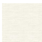
gebleicht Art.-Nr. 6805