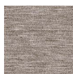
mocca Art.-Nr. 6838