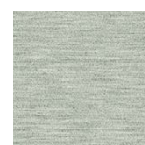
lorbeer Art.-Nr. 6862