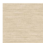
natur Art.-Nr. 6801