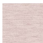
mauve Art.-Nr. 6831