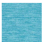
türkis Art.-Nr. 6865