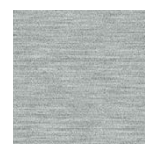
silber Art.-Nr. 6891